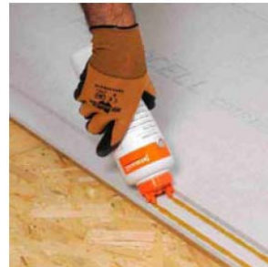
Auftragen des FERMACELL Estrich-Klebers im Falzbereich

Unsere Empfehlungen basieren auf umfangreichen Prüfungen und Praxiserfahrungen. Sie ersetzen nicht Richtlinien, Normen, Zulassungen sowie mitgeltende technische Merkblätter. Wegen der Vielzahl möglicher Einflüsse bei der Verarbeitung und der Anwendung empfehlen wir, stets eine Probeverarbeitung und -anwendung vorzunehmen. Aus den Angaben können keine Ersatzansprüche hergeleitet werden. Lieferung, Abwicklung und Gewährleistung auf die von uns zugesicherten Eigenschaften erfolgt gemäß unserer aktuell gültigen Allgemeinen Verkaufs- und Leistungsbedingungen.