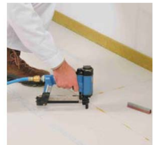
... oder Spezialklammern innerhalb von 10 Minuten