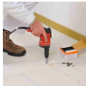
Befestigen durch Verschrauben...