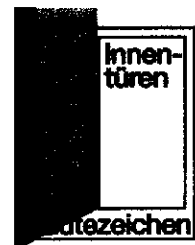
Der Vorsitzende der Gütegemeinschaft

Gütegemeinschaft Innentüren aus Holz und Holzwerkstoffen e.V. Ursulum 18 D-35396 Gießen