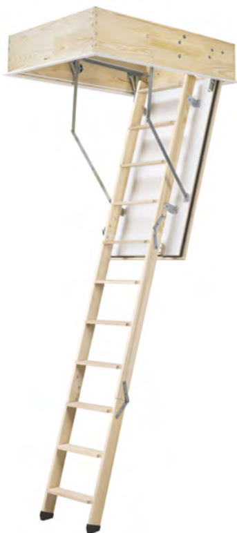
Die Bodentreppe mit TOP-Wärmedämmung und leichtem Einbau