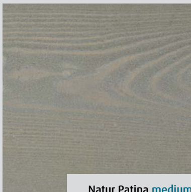
Natur Patina medium