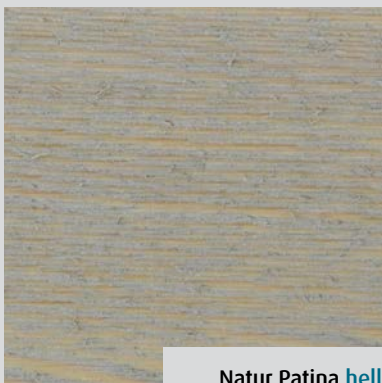
Natur Patina hell