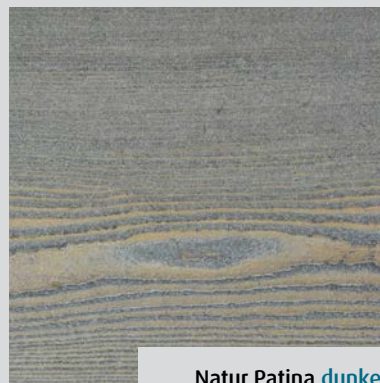
Natur Patina dunkel