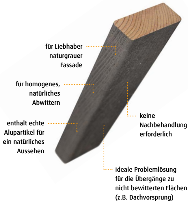
Abbildung: Rhombusleiste TPS 21 in Sib. Lärche Dimension: 26 x 69 mm

Ist die Fassade montiert, zeigt sich ab dem ersten Tag eine vergraute Front. Wittert im Laufe der Zeit die Oberfläche ab, so tauscht sich die werkseitige mit der natürlichen Vergrauung. Optisch behält dadurch die Holzfassade eine durchgehend natürliche Patina. Dabei passen auch die wettergeschützten Bereiche langfristig zum Gesamterscheinungsbild, denn die ungewollten Farbunterschiede in den typischen Bereichen wie z.B. Dachüberstände und Fensteranschlüssen werden vermieden.