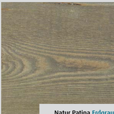
Natur Patina Erdgrau